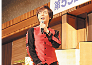
アトラクション (歌:竹島宏)