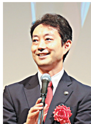
来賓祝辞 (熊谷俊人・千葉市長)