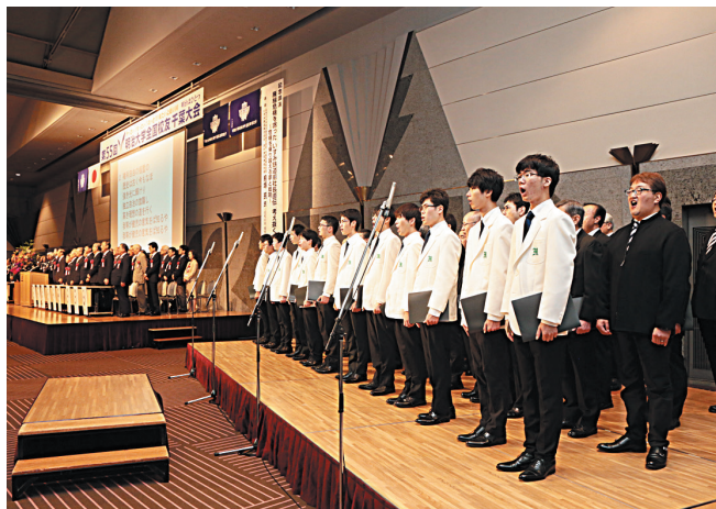
オープニング(グリークラブ、グリークラブ08会合唱団)