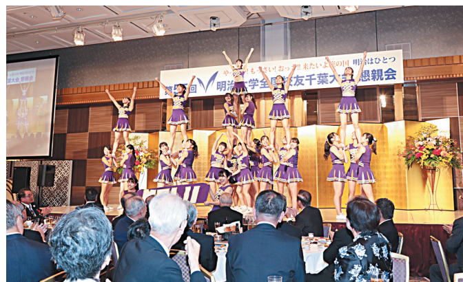
アトラクション「スタント」(応援団)