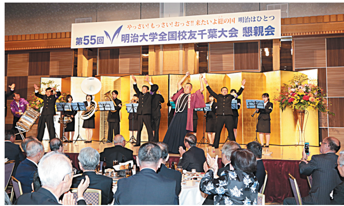
アトラクション「明大節」(応援団)