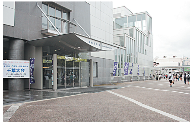
記念式典会場(幕張メッセ国際会議場)

外支部から延べ1600余名のご参加を得て、幸い天候にも恵まれ盛会裡に開催出来ました上無事終了することが出来ました。これも偏に校友はじめ関係各位の格別のお力添えの賜物と重ねて厚く御礼申し上げます。北野校友会長はじめ御柳理事長からも大盛況のうち終えられたことに御礼のご挨拶がありました。明治大学の発展に大いに寄与したと思います。新型コロナウイルス感染という先の見えぬウイルスとの闘いではありますが、校友皆様には健康に留意され益々のご健勝ご活躍を心よりご祈念申し上げます。