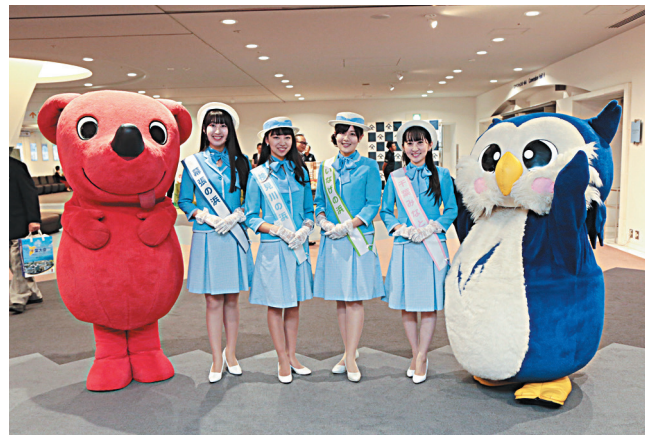
大会を盛り上げたキャラクター (左からチーバくん、千葉シティ5BEACH観光PR大使、めいじろう)