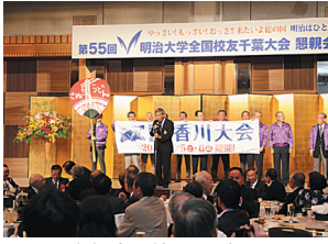
次年度開催県アピール (香川県支部の皆様)