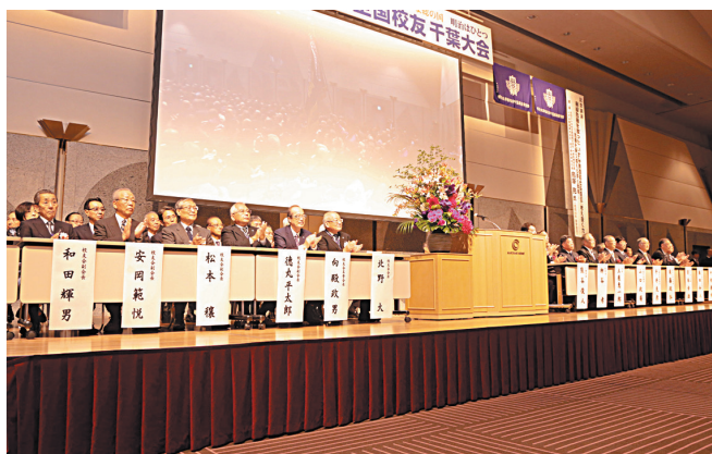
校友会および大学役員