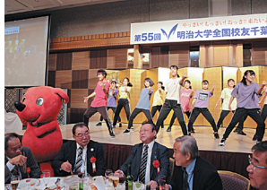
アトラクション(高校生ダンスパ フォーマンス:東京五輪首領 2020)