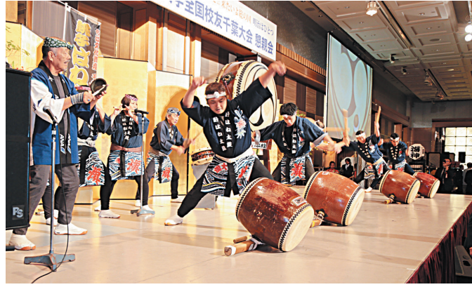
アトラクション(銚子はね太鼓)