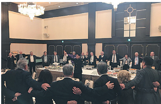
応援団と校歌斉唱