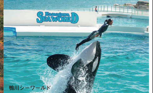
鴨川シーワールド