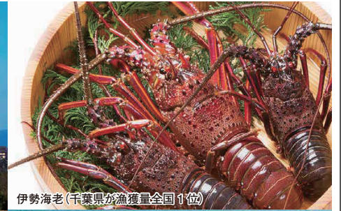
伊勢海老(千葉県が漁獲量全国1位)