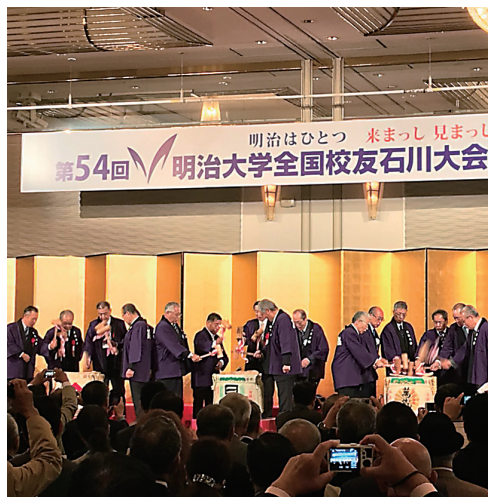
鏡開き(平成30年9月30日)