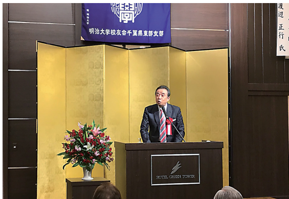
講演会:渡辺正行氏(平成31年2月9日)