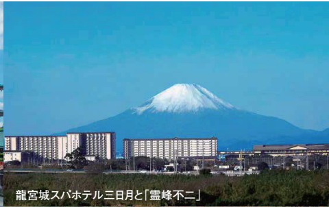
龍宮城スパホテル三日月と「霊峰不二」