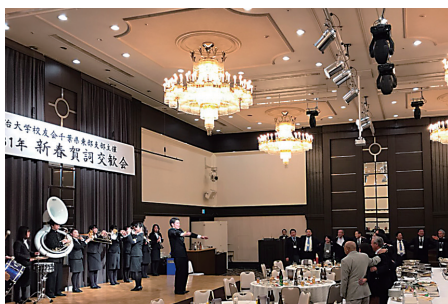
応援団(平成31年2月9日)