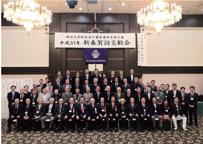
新春賀詞交歓会(平成31年2月9日)

●発行人：小関道生 ●発行：明治大学校友会千葉県東部支部事務局 千葉市若葉区北大宮台 42-9 小関道生方 ●題字：飯高和子先生 ●制作：株式会社千葉日報社