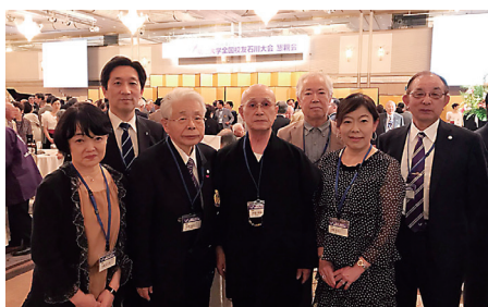
第54回全国校友石川大会(平成30年9月30日)