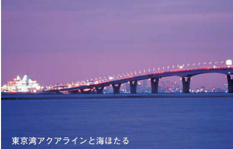
東京湾アクアラインと海ほたる